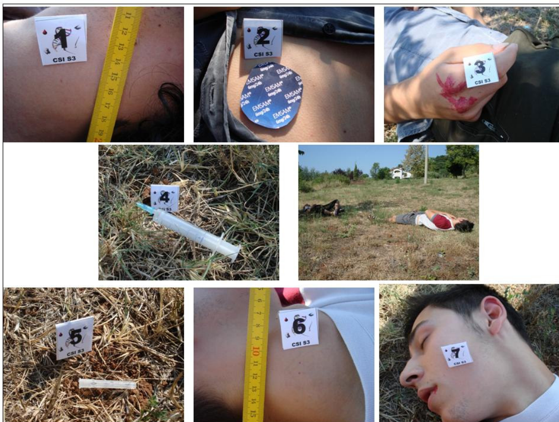
Slika 1. Fotografije sa mjesta „zločina“ koje je korišteno kao predložak za projekt

Na mjestu „zločina“ pronađena su 2 trupla, na jednom je pronađen ubod igle (1) te injekcija s ostatkom tekućine u blizini (4). Na ruci žrtve koja je ubodena pronađeni su tragovi krvi (3) te flaster Emsam (2). Na drugoj žrtvi pronađeni su tragovi ugriza zmijske (6) i rana na usnici (7). DNA analizom ustanovljeno je da trag krvi s ruke jedne žrtve odgovara krvi druge žrtve što potvrđuje pretpostavku da je došlo do fizičkog obračuna između dvije žrtve prije smrti. Rezultati DNA analize prikazani su na slici 2. Jedna od žrtava preminula je zbog zmijskog ugriza čiji su tragovi jasno vidljivi u predjelu vrata. Poznata je činjenica da su zmijski otrovi mahom proteini stoga su analizirani SDS-PAGE-om uz western analizu. Test je proveden na dva tipa zmijskih otrova, od kojih se pokazalo da jedan odgovara otrovu u